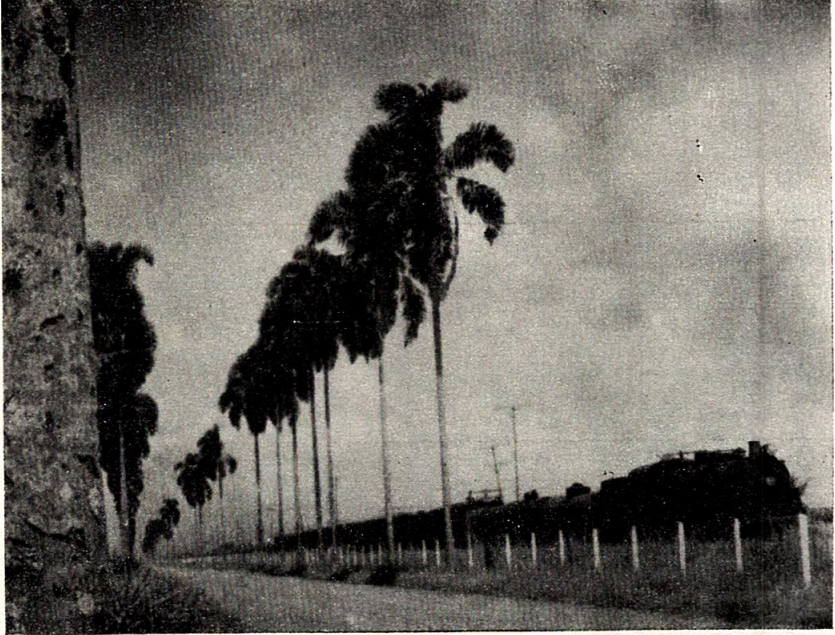
Fig. 1. Avenida de palmas zanconas del Valle ( Syagrus sancona ), paralela a la vía del Ferrocarril del Pacifico, en el costado noroccidental del Centro de Investigaciones Agrícolas de Palmira, Colombia. Fotografía tomada en 1957 por el Arq. Manuel Patiño. Las palmas faltantes en las hileras, fueron posteriormente repuestas con ejemplares de la palma Chrysalidocarpus lucubensis , del Africa meridional, que tiene aspecto diferente al de la zancona. A esta avenida se alude en las páginas 88-89 del texto.